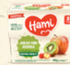
Hami 100% ovoce 4x 100 g